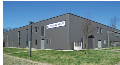
Das neue Logo ist bereits installiert: Die ERGOKONZEPT AG setzte bei der Auswahl der Immobilie insbesondere auf deren verkehrsgünstige Lage in der Nähe der A12 und auf das gewachsene Umfeld im Technologiepark Ostbrandenburg in Frankfurt (Oder). Die hochmoderne Halle wurde 2008 erbaut und eignet sich sowohl für Forschung und Entwicklung als auch für Produktion. Sie verfügt über eine Nutzfläche von 2.250 Quadratmetern und beinhaltet neben den Büro- und Produktionsflächen auch zahlreiche Labore.