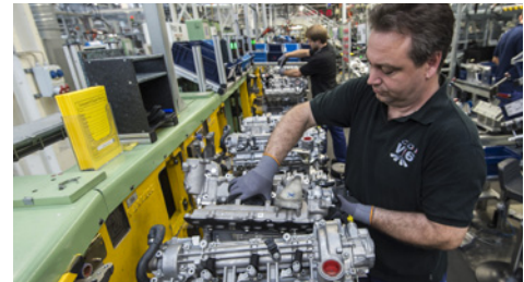
Ein Daimler-Mitarbeiter montiert einen Mercedes-Benz V6-Dieselmotor vom Typ OM642, der in der E- und S-Klasse sowie in Mercedes-Geländewagen zum Einsatz kommt. In Berlin wurden im vergangenen Jahr 126.716 solcher Motoren hergestellt.

Der Stuttgarter Automobilkonzern Daimler AG investiert eine halbe Milliarde Euro in das Mercedes-Benz-Werk in Berlin-Marienfelde. Hier werden unter anderem Dieselmotoren und Teile für Antriebe hergestellt. Mit der Großinvestition soll die Produktion in der Hauptstadt zu einem Hightech-Standort für die Komponentenfertigung ausgebaut werden. Profitieren werden davon auch eine Vielzahl an Zulieferbetrieben in der Region. Zudem wird Berlin zum weltweiten Daimler-Kompetenzzentrum für die Entwicklung und Produktion einer innovativen Motorsteuerung, die geringere Verbräuche und Schadstoffemissionen ermöglicht. Noch in diesem Jahr sollen die ersten 150 Millionen Euro investiert werden. Mit den verbleibenden 350 Millionen Euro werden dann in den nächsten Jahren hochautomatisierte Maschinen und Ausrüstungen angeschafft. | mehr Infos